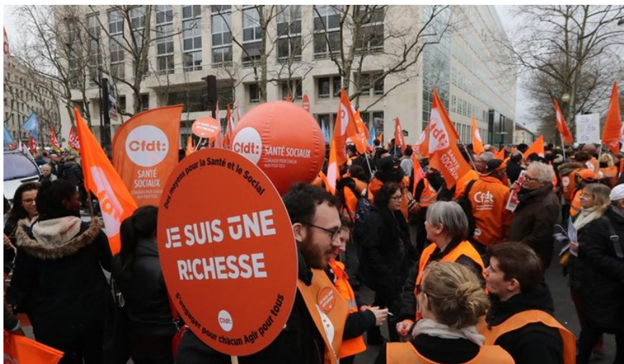
Il reviendra le temps de nous manifester sans masques !!